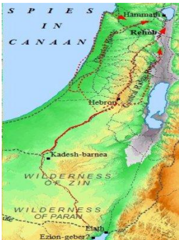
Hình 2.- Lộ trình (đường đứt quãng màu đỏ) của các điệp viên thám thính đất Ca-na-an trong vòng 40 ngày.

ứng với một ngày mà 12 điệp viên thám thính đất Ca-na-an, cho đến khi tất cả mọi người từ 20 tuổi sắp lên, trừ Giô-suê và Ca-lép, chết hết trong sa mạc, chỉ thế hệ con cháu của họ mới được vào đất hứa mà thôi [4].